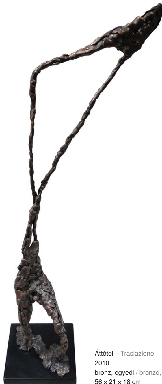
Áttétel – Traslazione 2010 bronz, egyedi / bronzo, esemplare unico 56 x 21 x 18 cm