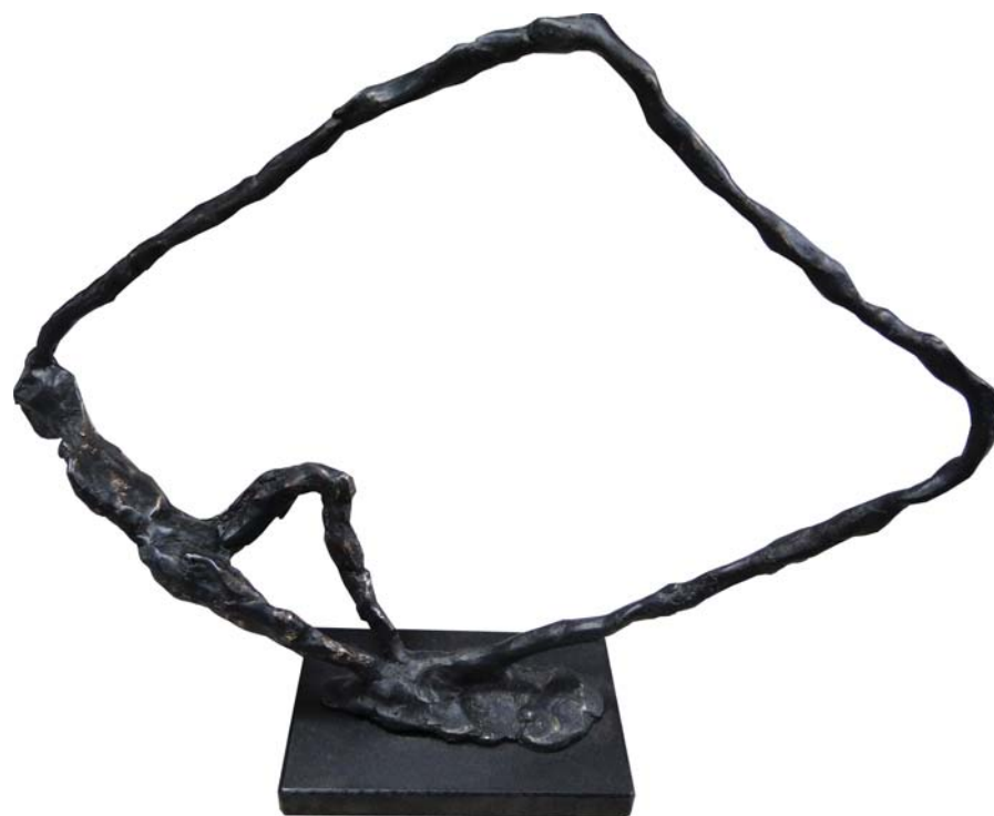
Négyzetbe írt – Inscrizione in un quadrato 2010 bronz, egyedi / bronzo, esemplare unico 20 × 24,5 × 7,5 cm