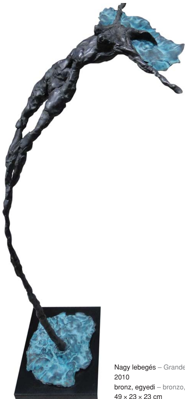
Nagy lebegés – Grande galleggiamento 2010 bronz, egyedi – bronzo, esemplare unico 49 × 23 × 23 cm