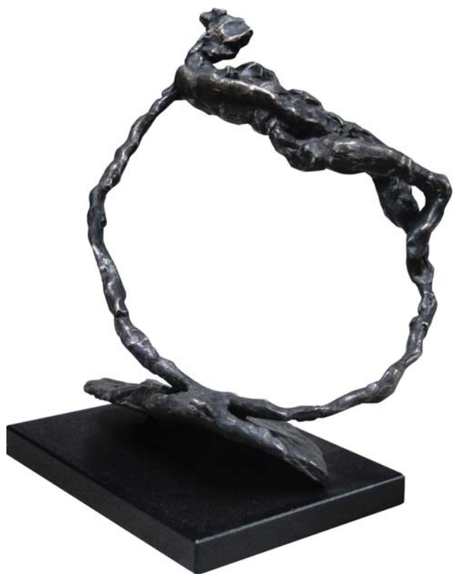
Körkörös – Circolare 2010 bronz, egyedi / bronzo, esemplare unico 22 × 18 × 20 cm