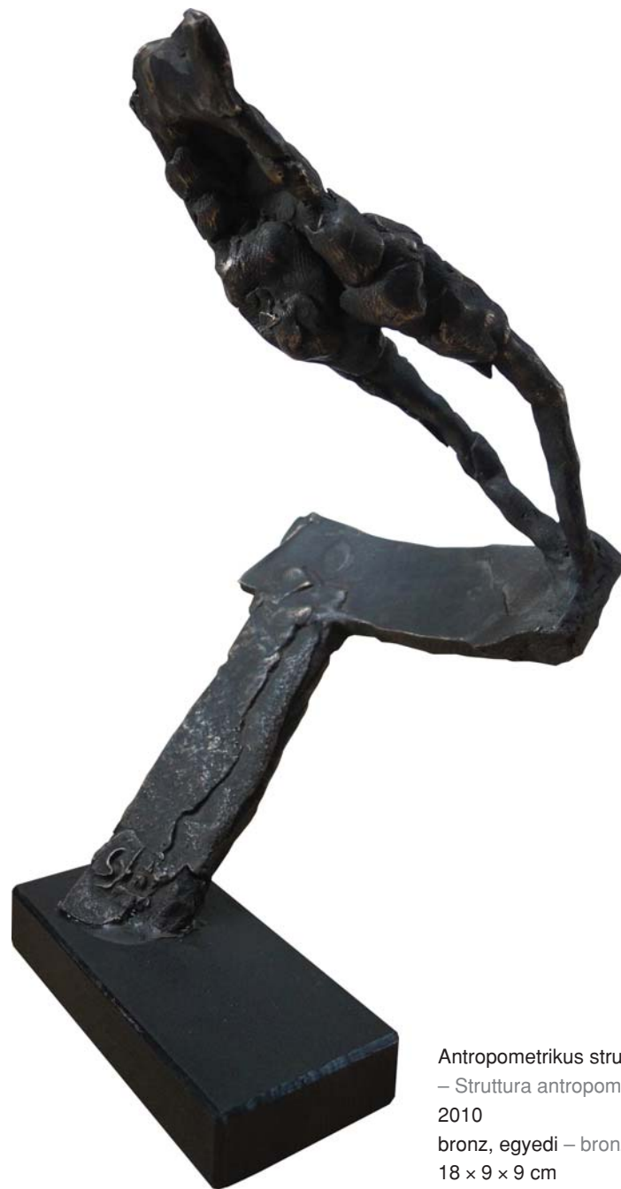
Antropometrikus struktúra – Struttura antropometrica 2010 bronz, egyedi – bronzo, esemplare unico 18 × 9 × 9 cm