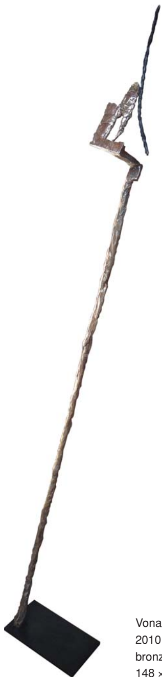
Vonalak – Linee 2010 bronz, egyedi / bronzo, esemplare unico 148 x 34 x 19 cm