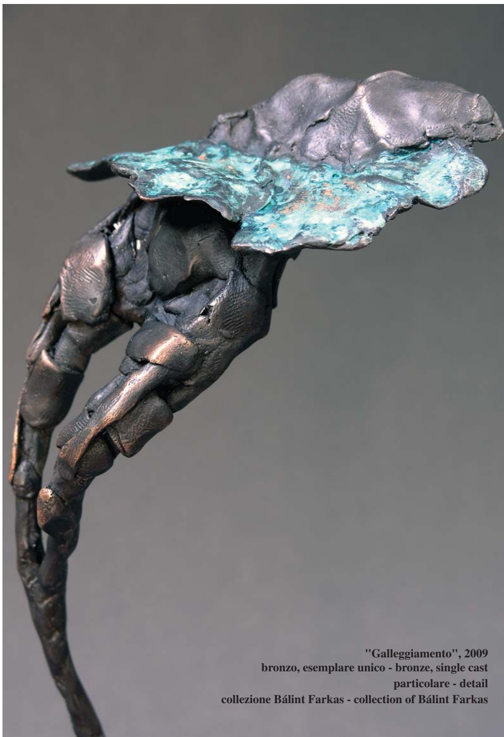
"Galleggiamento", 2009 bronzo, esemplare unico - bronze, single cast particolare - detail collezione Bálint Farkas - collection of Bálint Farkas