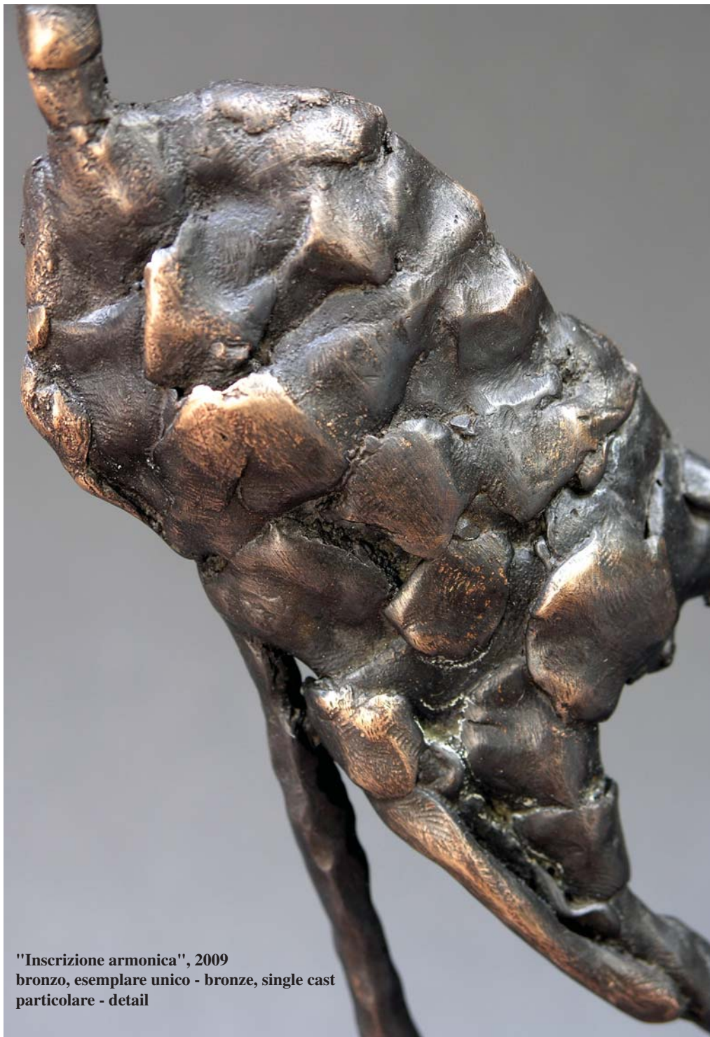
"Inscrizione armonica", 2009 bronz, esemplare unico - bronze, single cast particolare - detail