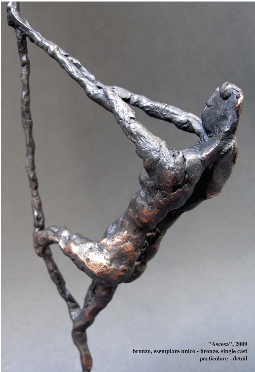
"Ascesa", 2009 bronzo, esemplare unico - bronze, single cast particolare - detail